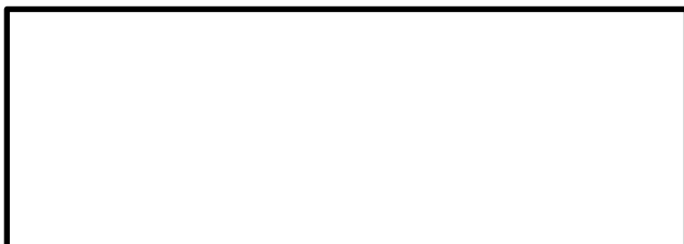
Gambar 2. Contoh Traffic

Berikut adalah contoh traffic yang memiliki estimate berdekatan dan harus diberikan EAT berdasarkan laporan bulanan traffic pada bulan november: